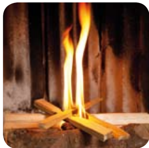
Durch ausreichend Luftzufuhr rasch helle, hohe Flammen herstellen.