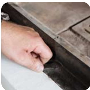
Luft- und Drosselklappen ganz öffnen.