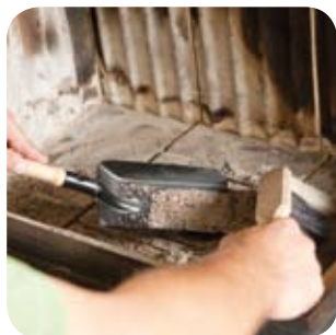
Den Ofenraum von Asche säubern.