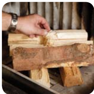
Anzündhilfe auf den Brennholzstapel legen.