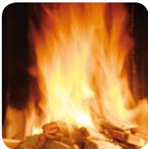
Ein kräftiges Feuer garantiert einen guten Abbrand.