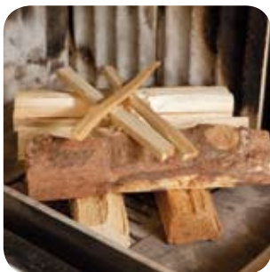
Holzspäne gekreuzt darüber platzieren.