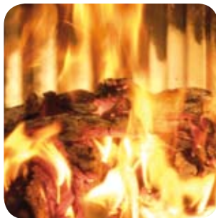
Luftzufuhr erst drosseln, wenn sich ein schöner Glutstock gebildet hat.