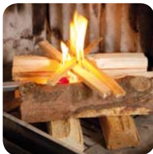
Von oben anzünden.