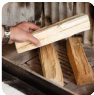
Das Holz locker in den Brennraum schichten.